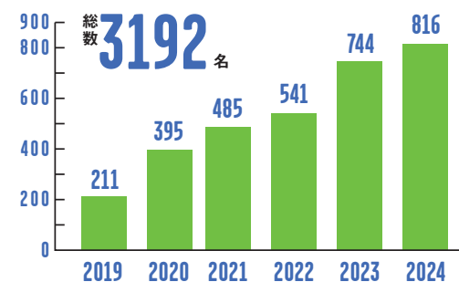
地域みらい留学生数(1年生の入学者数)

A これからの「正解のない世界」を生きていくために必要な、「自分で考え、挑戦し、自ら未来を作る機会」が地域には溢れているから。